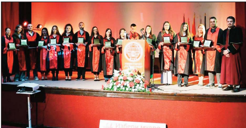
Призанија и за најдобрите студенти

Универзитет во рамки на државата и регионот. Имено Универзитетот „Гоце Делчев“ – Штип стана полноправна членка на Меѓународната асоцијација на универзитети од Јадранско-јонскиот Регион, насловена