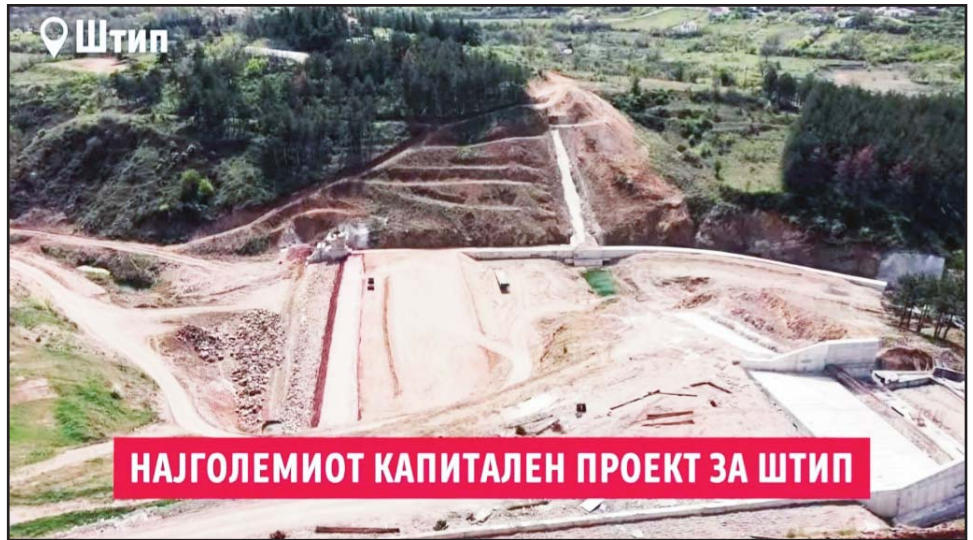
Брана на реката Отиња

лика од минатото кога живеевме во режимот на ВМРО ДПМНЕ. Затоа денес кога слушам критика за едната и за другата страна, јас лично тие критики ги гледам како