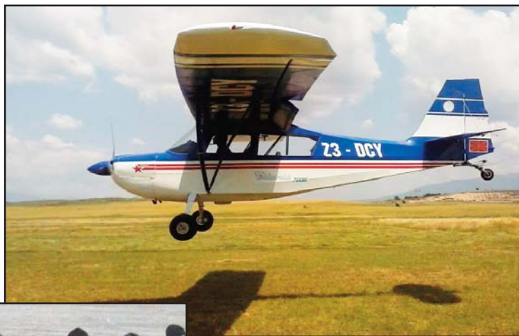
↑ Еден од авионите на Аеро клуб Штип

Во 2013г Аеро Клубот Штип – Штип е добитник на престижната награда “PAUL TISSANDIER”, од страна на светската воздухопловна асоцијација FAI за посебен придонес во развојот на воздухопловството. 100 години Аеро Клуб Штип – Штип. – „Не случајно се наоѓаме на врвот на воздухопловната пирамида како организатори