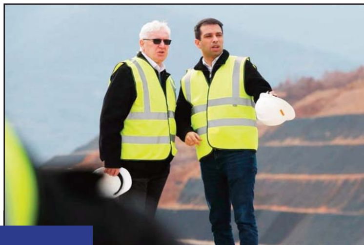
Бочварски на терен

Кога зборуваме за реализација на ветеното, веќе спомнав дел од конкретните достигнувања во