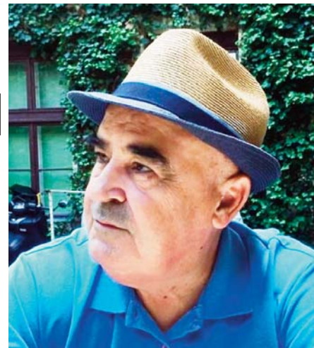
Разговор со поетот Ристо Лазаров

Да читаат, да читаат и со ококорени очи да врват во секојдневието и да ги откриваат неговите вредности и тајни.