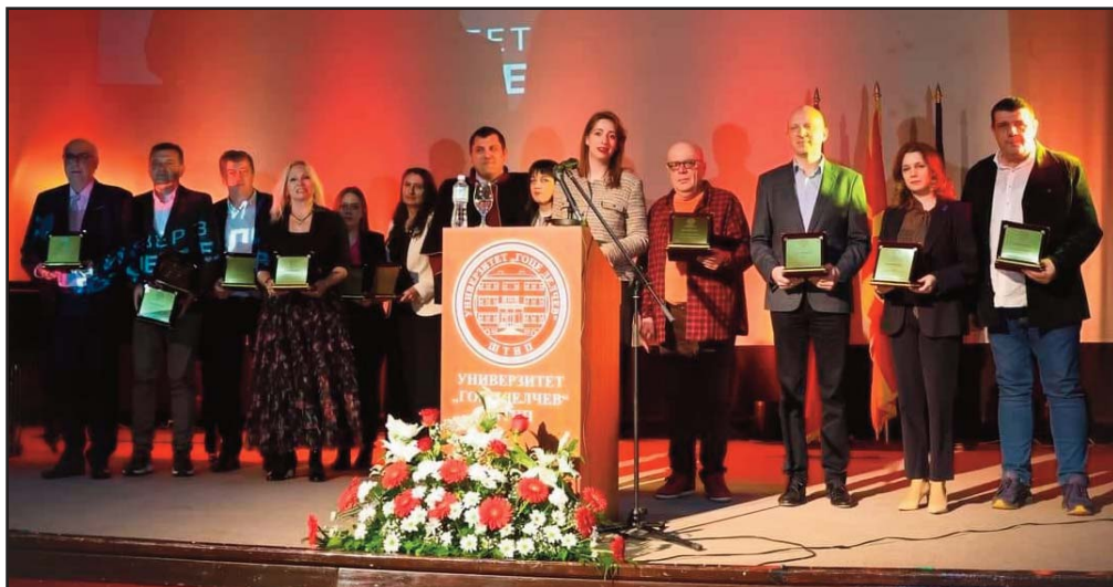
Промовирани деветмина нови доктори на науки на УГД

Со гордост можеме да зборуваме за поставеноста на нашиот