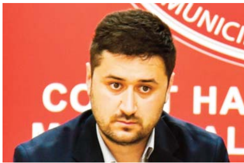
Пишува: Роберт Аćипетров