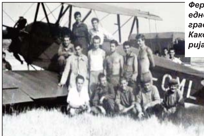
Пилоти и обожаватели

со над 100 натпревари и учесници на преку 150 првенства во домашни и меѓународни натпревари на сите воздухопловни дисциплини на кој сме добитници на над 500 пехари и медали како во екипна така и во поединечна конкуренција“, коментира првиот човек на клубот.