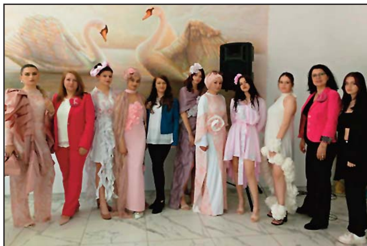
Сите фотографии се од модната ревија. Креациите се на ученичките кои се и во улога на манекенки

организирана модна ревија, со што докажавме дека со посветена и одговорна работа се постигнуваат најдобрите резултати. Оваа награда, своевидно, претставува дополнителна мотивација и инспирација и за самите наставници и ученици да се работи уште повеќе и да се истакнат и искористат стекнатите знаења и вештини за нови, поголеми предизвици.