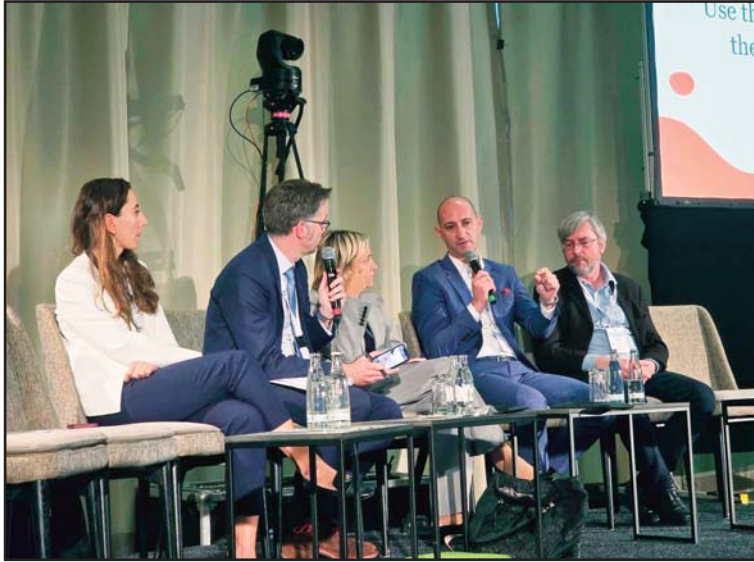
Огромно задоволство и чест ми беше што бев дел од Европското Бифуркационо Здружение (ЕВС), каде на моето прво присуство добив покана од страна на бордот на интервени кардиолози да бидам панелист на една од најинтересните сесии на овој конгрес.

ботен ден на неколку дела, ехо кабинет, потоа влегувате во ангиографска сала каде стентираме и потоа ги лекуваме пациентите на интензивно лекување. Кога ќе го разделите работното време секогаш недостасуваат уште неколку часа за да завршите сè. И затоа верувајте дека јас дома ручам секогаш сам, зашто сопругата и децата ќе завршат во 14,00 часот, а то време јас сум обично заглавен во сала. Затоа ја немам таа привилегија за семеен ручек каква што ја имаат најголем број наши сограѓани, но ручам сам а покрај мене се се со-