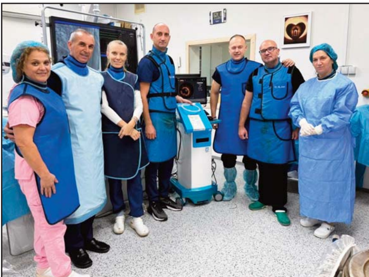
Тимот на кардиолошкото одделение при Клиничка болница Штип

-Видете, сите оние граѓани кои имале мака, а ние како кардиолошки тим сме им помогнале да си ги решат своите здравствени проблеми, тие луѓе стануваат инаши лични пријатели. Од тука секој еден од нив лесно ќе ве пронајде на социјалните мрежи и на тој начин имаат лесен пристап да прашаат и да добијат одговор. Токму затоа социјалните мрежи ни се од голема корист на сите, и на пациентите, но и на докторите, зашто со давање одговори на социјалните мрежи вие сте го упатиле пациентот каде да се лекува, а со тоа сте намалиле дел од редицата за чекање на оние кои не се за на кардиолог.