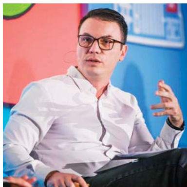
Пишува: м-р Игор Стојанов

В о современа Македонија, демократијата е термин што често го споменуваме, но дали навистина го живееме? Демократијата подразбира владеење на народот, слободен избор и независност на институциите. Реалноста, сепак, ни покажува дека сме далеку од овој идеал. Во Македонија, политичките партии не само што доминираат во нашите животи, туку имаат огромно влијание врз сите аспекти на општеството – од индивидуалната професионална кариера до функционирањето на јавните институции. Оваа ситуација наликува на диктатура, но таа диктатура е озаконета и прикриена буквално со членови во законите.