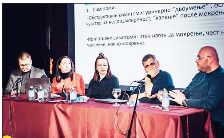
Учесници во дебатата

На оваа панел дискусија присутните можеа да се запознаат со детали за дијагностиката, евалуацијата и