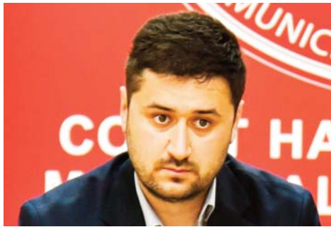
Пишува: Роберт Аципетров