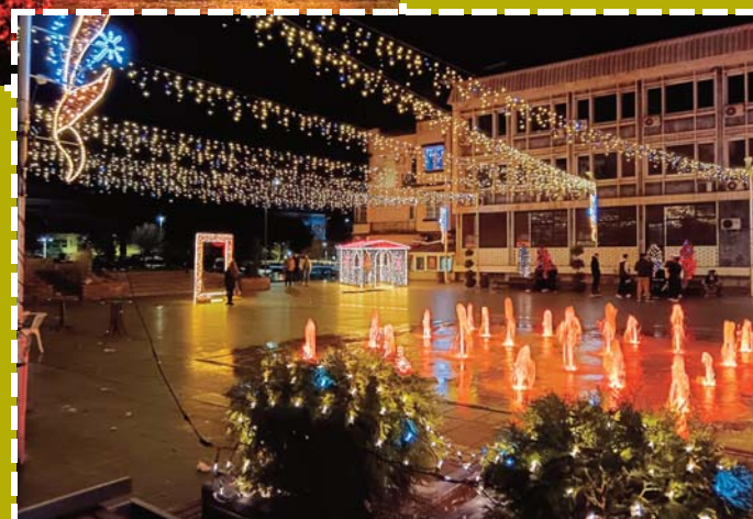
Амбиент како од соништата