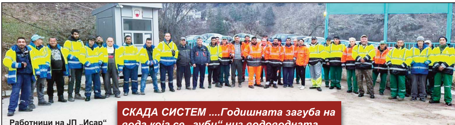
Работници на ЈП „Исар“ во новите ХТЗ одеа набавени пред месец дена

-Да, во тек е постапка за набавка на три специјализирани возила кои што ќе бидат во функција на подобрување на услугите што ние ги испорачуваме кон граѓаните. Станува збор за возила што ни недостасуваат а истите ќе го рационализираат трудот на вработените. Се работи за мултифункционален камион за метење и одржување на коловозите и тротоарските површини кој има можност преку соодветен приклучен додаток да собира и падната лисна маса, нанесен песок и земја по коловозите. Набавуваме и цистерна за миење на улици која ќе биде постојано во функција за одржување и миење на улиците согласно програма за работа како и набавка на популарно наречената каналџетка, специјализирано возило за интервентно но и по-