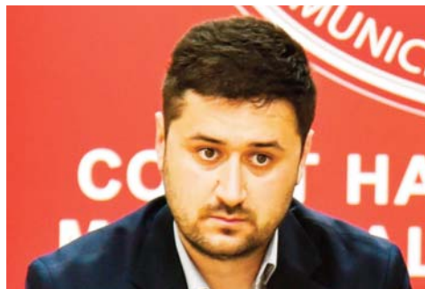
Пишува: Роберт Аципетров