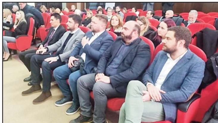
Учесници во дебатата

— Не смееме да дозволиме општините, градоначалниците вклучувајќи се и јас самиот себе да оставиме можност да не се развиваат општините и ова да