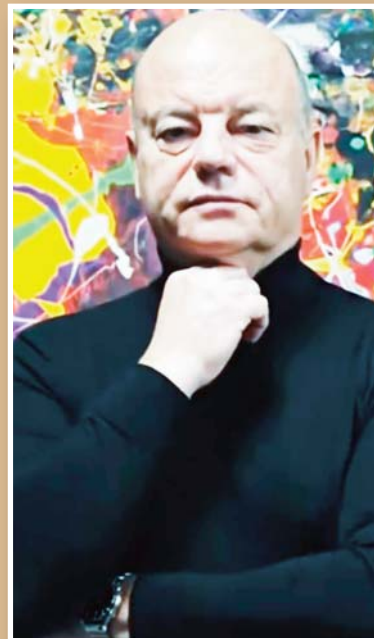
проф. д-р Јордан Ѓорчев

„На ова место вредно е да се напомене сепак дека самиот процес на настанување на сликите и методологијата на создавањето на истите е прилично различна кај Јордан Ѓорчев во однос на методологијата кај Џексон Полок и по тоа Ѓорчев е посебен“.