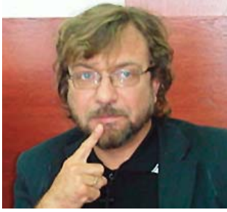
Пишува: М-р Трајче КАЦАРОВ, писател