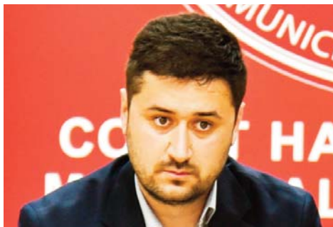
Пишува: Роберт Аципетров

К ога во Македонија се споменува „оптимизација“ во образованието најчесто прва асоцијација е „затворање на училиште“ што неминовно носи страв и несигурност. Впрочем овој страв потекнува од фактот дека училиштата од година во година се по-празни и попразни. Суштината на оптимизацијата не треба да се бара во намалување на бројот на луѓе, туку во подобро организирање на наставниците како и ресурсите што веќе постојат. Во услови кога бројот на ученици во одредени средини се намалува, државата се поотворено најавува дека образовниот систем ќе мора да се приспособи на реалните потреби. Министерството за образование и наука веќе зборува за оптимизација на училишната мрежа, односно укинување на практиката да функционираат паралелки со само неколку ученици.