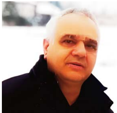
Пишува: Ристо Божидар Аризанков