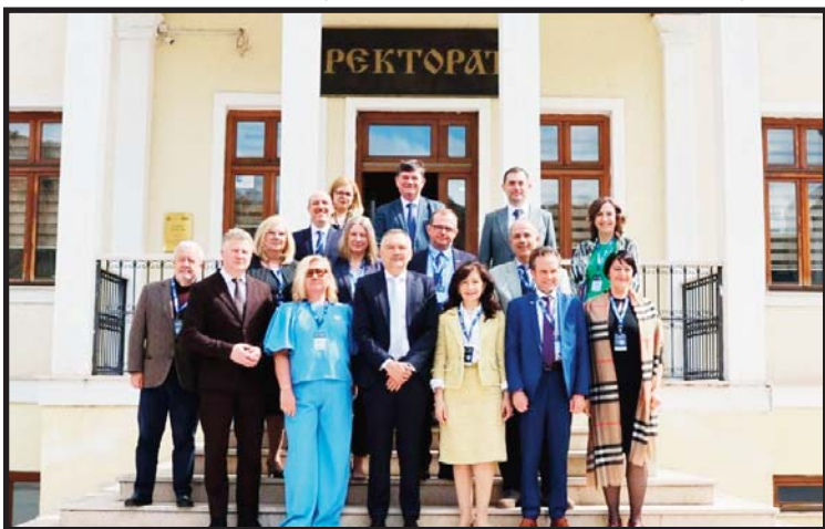
Членови на Европската универзитетска алијанса пред ректоратот во Штип

Н ад осумдесеттина гости од Европската универзитетска алијанса која ја чинат универзитети од девет европски држави, беа во Штип како гости на Универзитетот „Гоце Делчев“ кој е дел од алијансата. Во нашиот град и на нашиот Универзитет гостите имаа цела една работна недела при што заедно со професорите на УГД и студенти работеа на креирање на нови заеднички студиски програми, на подобрување